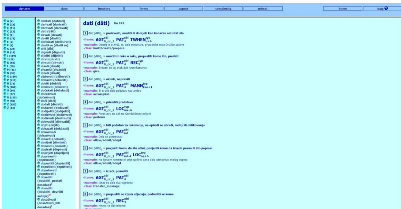
Figure 4 : Capture d'écran pour le verbe dati 'donner' dans la base CROVALLEX CROVALLEX 1.0 (ffzg.hr) (accédé le 15 mars 2023)