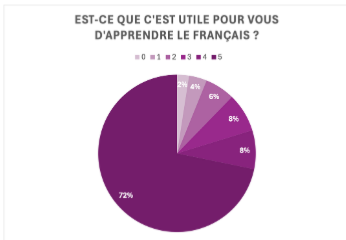
Figure 1 : Utilité d'apprendre le français pour les répondants

Si nous cumulons les réponses 3, 4 et 5, 88% des personnes interrogées estiment qu'apprendre le français est utile et seulement 12% estiment que ça ne l'est pas ou peu (réponses 0,1 et 2).